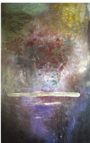
Solstici 2. 2000

L'artista entén que la natura és "el tot" que ens envolta, una força vital que travessa el temps, però que també hi està subjecta pels canvis que comporta el cicle de la vida, que es van repetint. És una font de contemplació externa, que esdevé el vehicle d'un viatge interior on troba elements d'identificació que l'inspiren i l'empenyen a expressar-se.