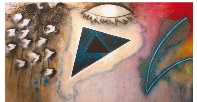
País Paisatge (fragment). 2019

Gerard Sala va demostrar que la introspecció és compatible amb el compromís polític. En una primera etapa, les seves obres manifesten l'anhel de llibertat i democràcia que, en ple règim franquista, era compartit per altres artistes de la seva generació. Els darrers anys va viure amb intensitat i va plasmar en diverses obres la lluita per l'alliberament nacional de Catalunya que portaria al referèndum de l'1 d'octubre de 2017.