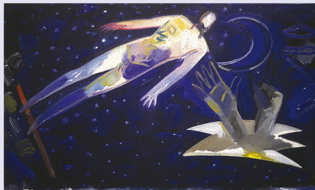
Sense títol. 1989

L'espiritualitat en Gerard Sala és un tret fonamental del seu caràcter i de la seva manera d'entendre el món que l'envolta i de relacionar-s'hi. Segons el moment, la producció de l'artista posarà èmfasi en la situació política, en l'ésser humà i el seu lloc en el món o en la riquesa de la natura, però sempre ho veurà tot a través del filtre d'una enorme sensibilitat poètica, impossible de concebre sense una rica espiritualitat.