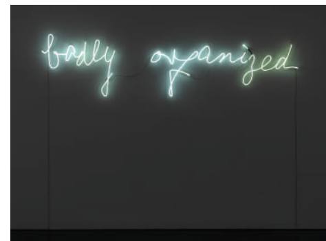
PETER FRIEDL Untitled (Badly Organized) 2003 Col·lecció MACBA. Fundació MACBA. Donació de l'artista © Peter Friedl, 2017

Seguint aquestes premisses, «Entusiasme. El repte i l'obstinació en la Col·lecció MACBA» proposa cinc aproximacions possibles basades en l'acte entusiasta: la construcció cosmogònica, la potència creativa de la vida quotidiana, la càrrega performativa del cos, l'activisme de caràcter social i la posada en crisi de la pròpia noció d' art . D'aquesta manera, la voluntat d'artistes com Zush, Anne-Lise Coste o Younès Rahmoun per construir un món propi mitjançant vivències, fantasies o creences; la repetició de gestos simples i quotidians d'Esther Ferrer, Ignasi Aballí, Dieter Roth, Richard Hamilton o Tere Recarens; la performativitat de Vito Acconci o Àngels Ribé; l'acció inconformista de Maja Bajevic, Emanuel Licha, Mireia Sallarès, Cildo Meireles o Gordon Matta-Clark, i, finalment, la crítica al propi sistema de l'art de figures de Marcel Broodthaers o Peter Friedl suggereixen una seqüència narrativa en què l'entusiasme denota una posició ideològica forta