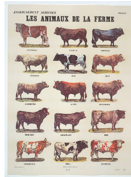
MARCEL BROODTHAERS Les Animaux de la ferme [detall] 1974 Col·lecció MACBA. Fundació MACBA © Estate of Marcel Broodthaers, VEGAP, Barcelona, 2017

En termes generals, l' entusiasme s'entén com un procés subjectiu d'exaltació de l'ànim, en què la passió i el fervor actuen com a detonant emocional d'allò que —ja sigui discret o ambiciós, íntim o públic— es vol aconseguir. Mitjançant una anàlisi plural del concepte, el projecte revisa la col·lecció del MACBA amb l'objectiu d'escenificar i contrastar tot un seguit de comportaments i actituds sensibles a aquesta excitació. Una posició ferma i obstinada que s'allunya d'actituds ingènues o simplement alegres i aposta per qüestions de confiança, resistència i furor a diferents nivells. L'exposició proposa un exercici d'activació de les obres, en què s'entrecreen causes i desafiaments diversos, cosa que dona lloc a una selecció de reptes singulars que, situats dins de l'àmbit de l'art contemporani, transiten entre les obsessions individuals i els compromisos d'ordre estètic, social o polític.